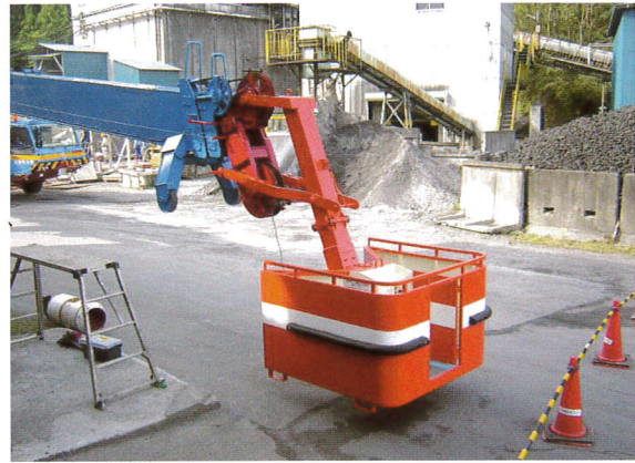
200T フルオートジブ取付

ボックスの外側は鋼板で囲い、高所においての搭乗者の風よけと恐怖心を少なくしています