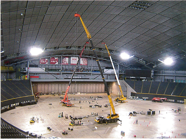
ドーム内 コンサート会場設営 60m作業 120Tクレーン