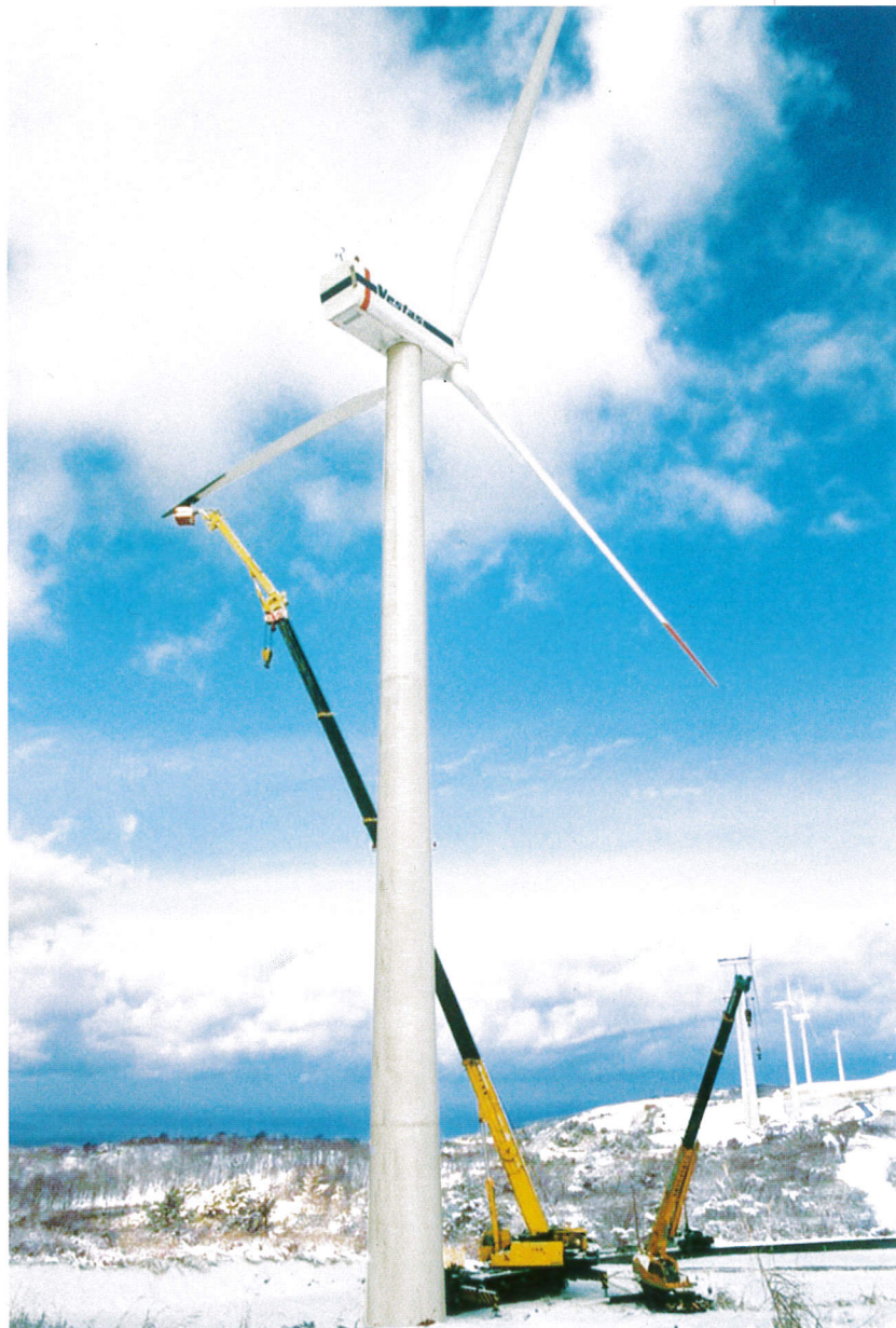
200Tフルオートジブ装着