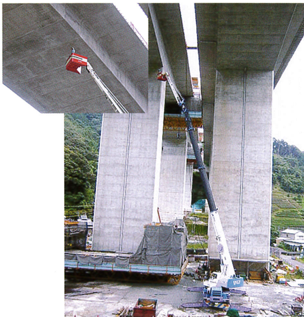
高速道 橋桁点検 40m作業 50Tラフター