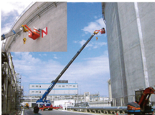
LNGタンク看板作業 半径25m 50Tラフター