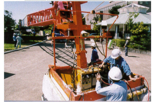
100m観音像リニューアル 100m作業 360Tクレーン