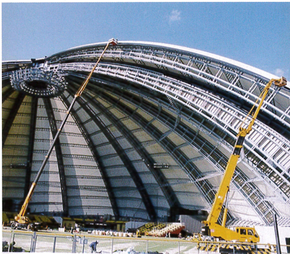
ドーム塗装 55m作業 50Tラフター