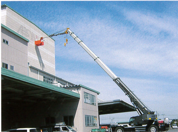
倉庫看板作業 半径30m 50Tラフター