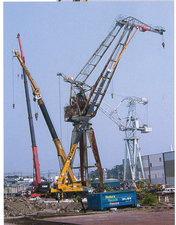
造船所クレーン解体 50m作業 50Tラフター