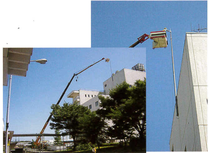
避雷針交換作業 半径30m 50Tラフター