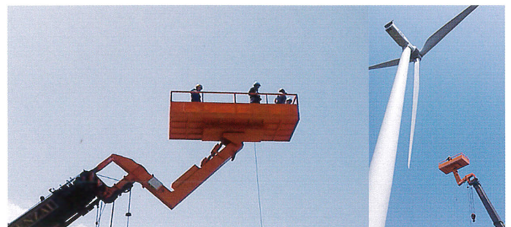
風力発電機 メンテナンス SS-450 60Tラフター取付