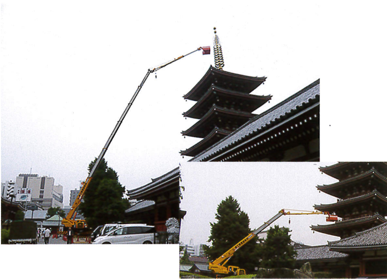
五重塔メンテナンス 50m作業 60Tラフター